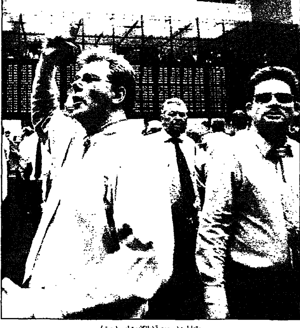
ممثلون في بورصة فرانكفورت اسس